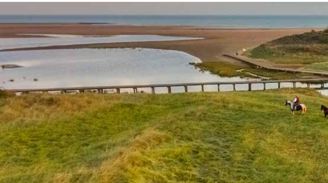
Cavaliers au sein de la réserve naturelle de Verdrongen Zwarte Polder