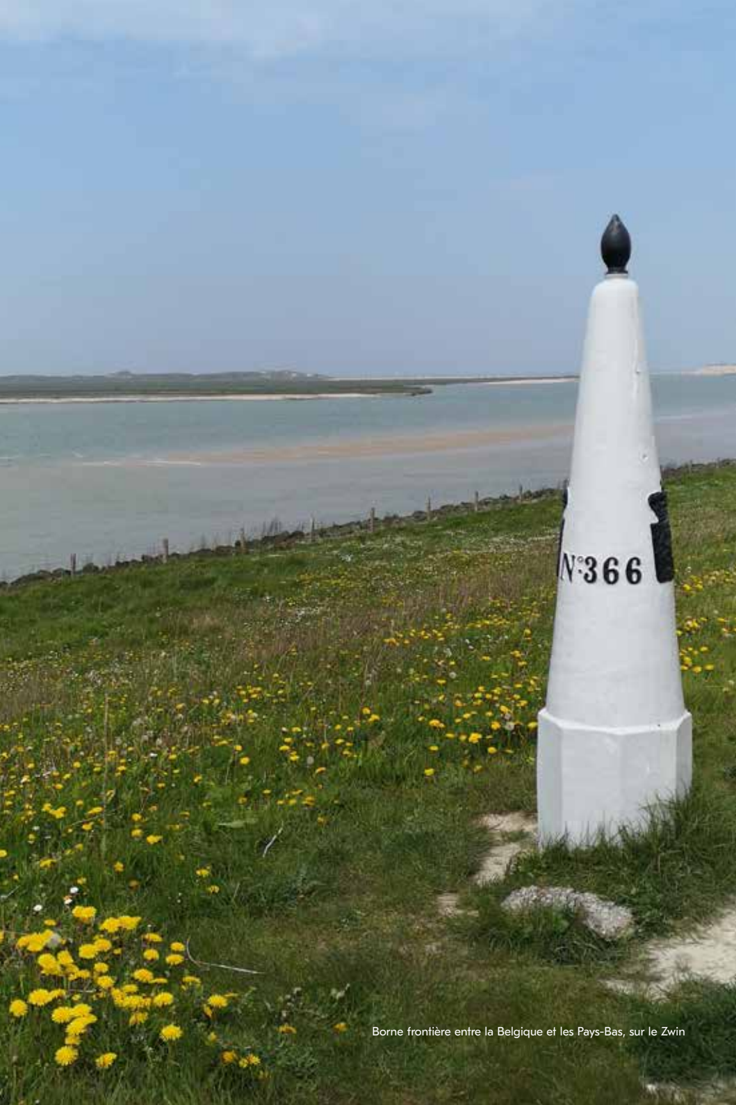
Borne frontière entre la Belgique et les Pays-Bas, sur le Zwin