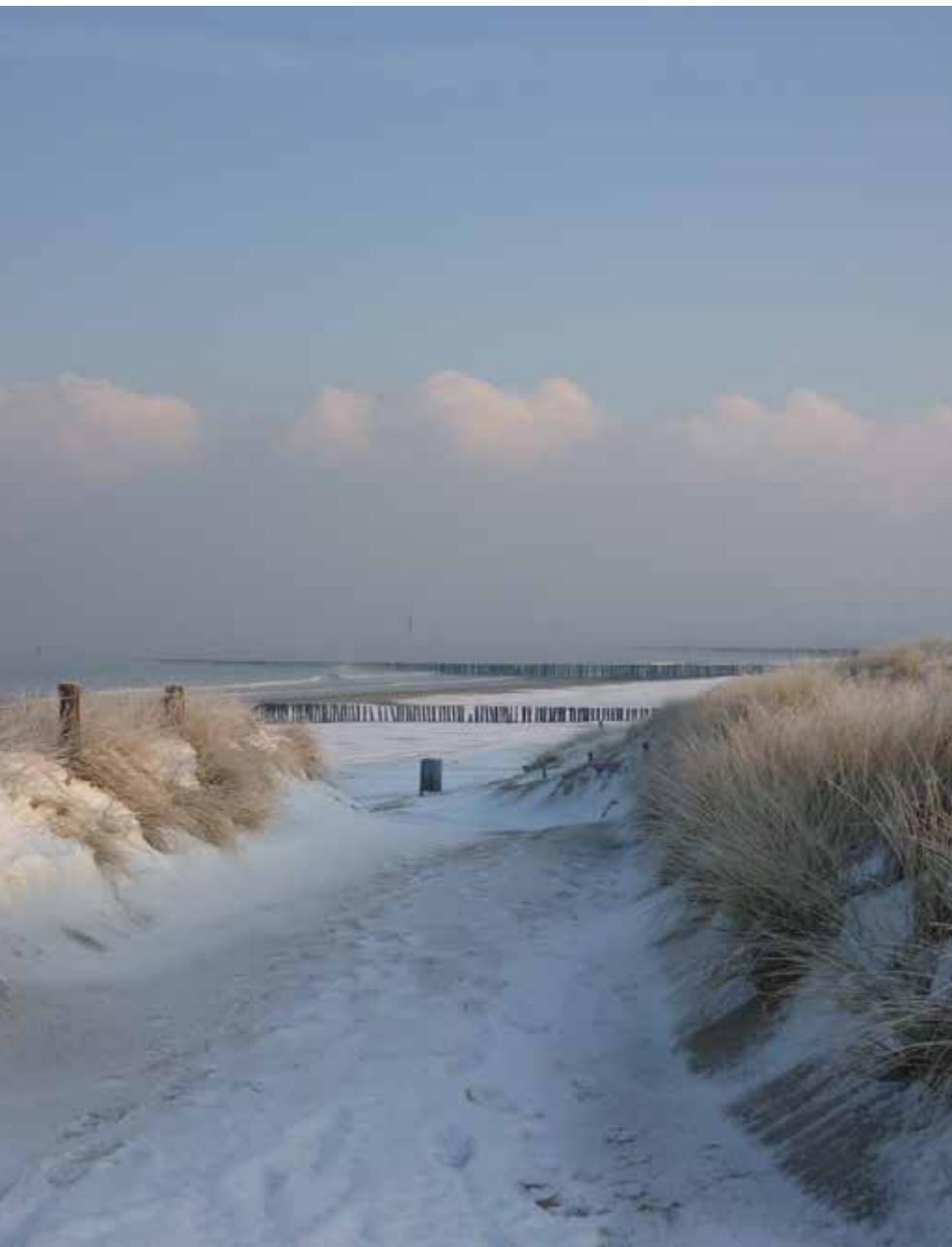
Dunes enneigées à Cadzand-Bad