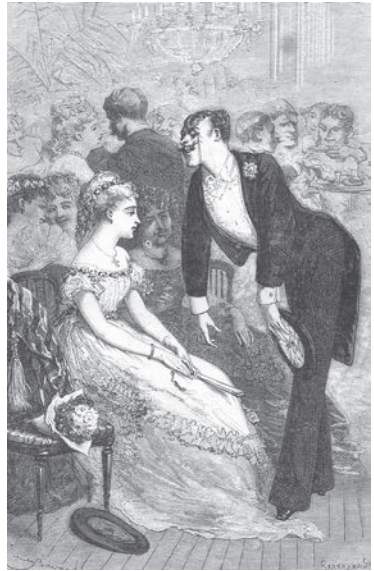
Femme du monde et mec qui lui fait la cour

Ainsi, dans un dictionnaire où les mots sont rangés par ordre alphabétique, on pourrait croire que Carlos, le chanteur, était le fils du roi d'Espagne, et François Valéry, le petit-fils de Paul. Et même lorsque vous découvrez Pie VI sous Pie V et au-dessus de Pie IX, vous vous demandez toutefois qui est le fils de qui ?