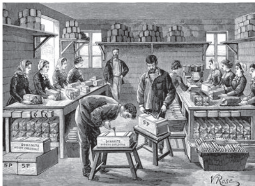
La FN d'Herstal à ses débuts

Premier créateur d'emploi dans le monde, notamment dans les secteurs des pompes funèbres, des incinérations, des prothèses, de la chirurgie réparatrice, des thérapies post-traumatiques et chez Médecins Sans Frontières. – *Citation. Durant sa campagne à travers tous les États : « On the road a gun! » (Donald Trump, candidat à la présidence des États-Munis d'Amérique)