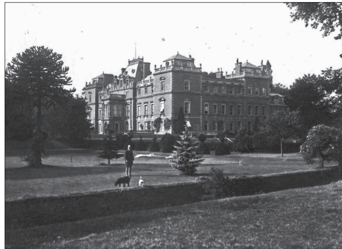
Le château de Newnham Paddox, ses 365 pièces et le comte de Denbigh au premier plan.

Dorothie Feilding est la descendante d'une des plus anciennes familles nobles d'Angleterre, fondée à la fin du XIII e siècle par Geoffrey Fielding, fils de sir Geoffrey qui a combattu lors des guerres du roi d'Angleterre Henri III. Un chercheur suggère qu'un certain Galfride Count de Hapsburgh et Domine de Rinfiliding , originaire d'Alle-