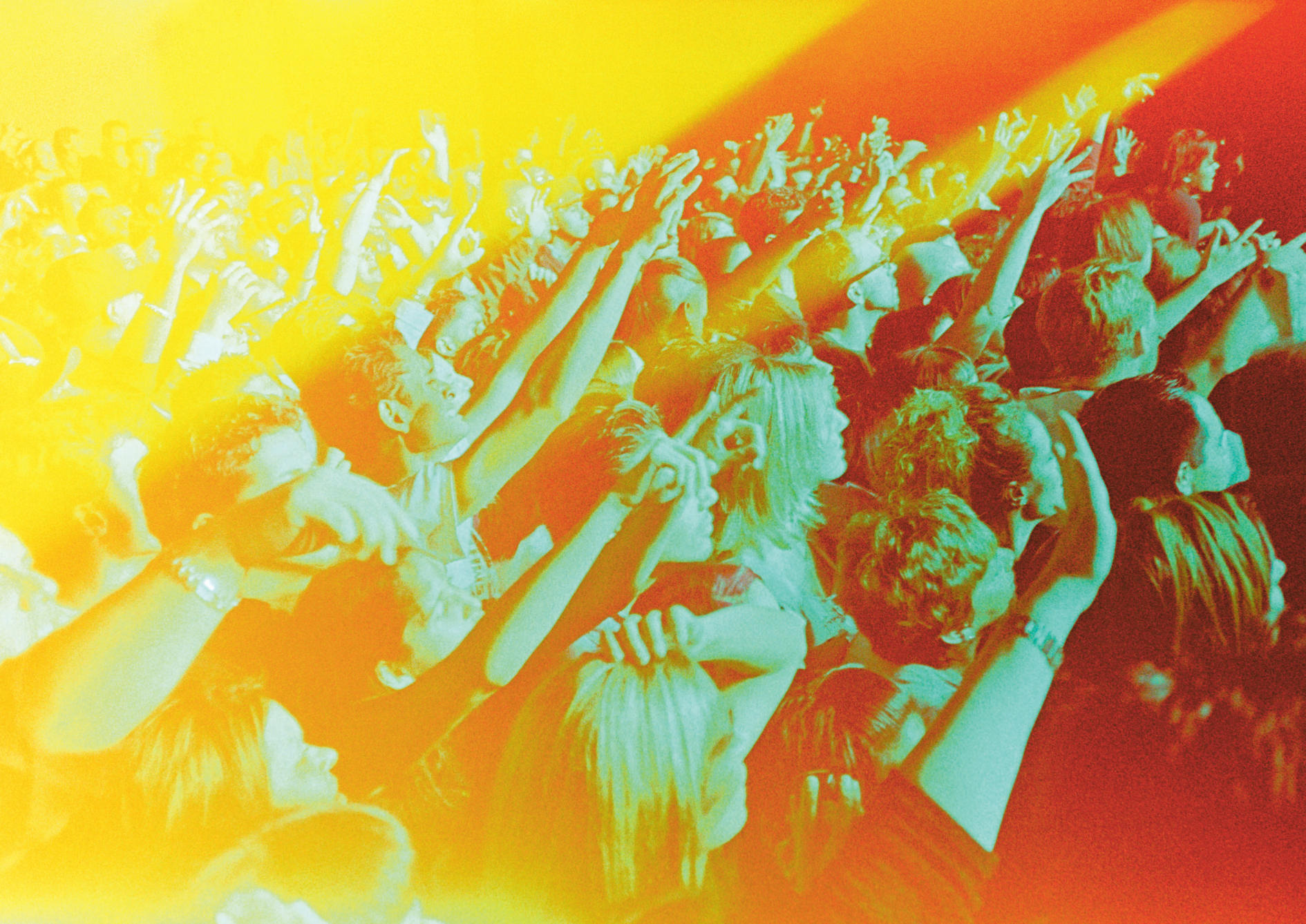
Morrissey