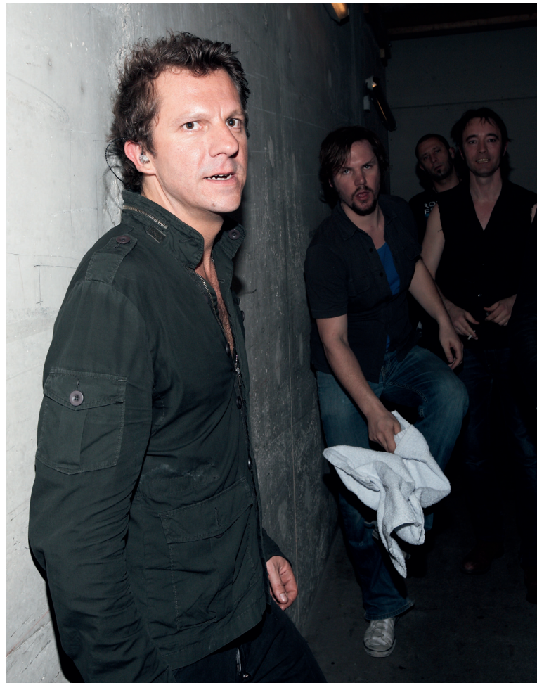
Tom Barman

Paradoxaal genoeg zijn dit de foto's waar men eveneens van smult: de artiest blijkt ook maar een mens te zijn. Tot dit beeldmateriaal kunnen wij ons verhouden; we begrijpen en interpreteren de emotie die we zien, omdat we die herkennen. Die visuele herkenning is dus van belang als een muzikliefhebber zich wil kunnen identificeren met een artiest. Net zoals hij zich moet kunnen herkennen in de teksten van de band waar hij graag naar luistert.