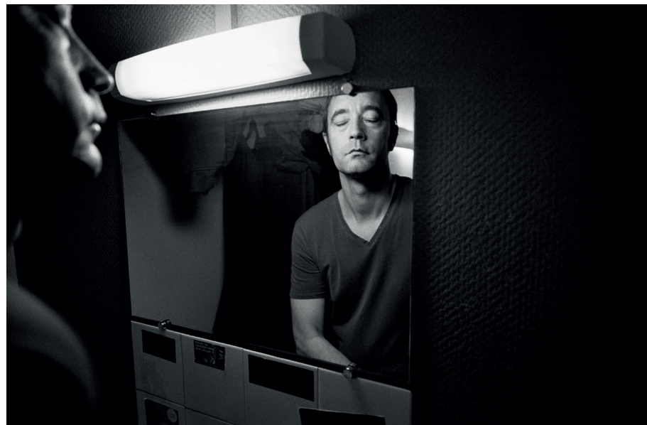
Charlie De Keersmaecker, dEUS , Vantage Point Tour, France, 2008