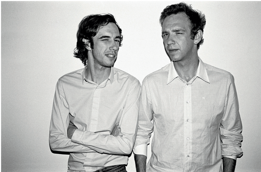
Alex Salinas, 2ManyDJs , 2005