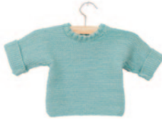
Jef, p. 28