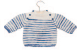
Flor (klein), p. 30