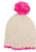
Ellen, p. 84