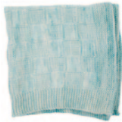
Minne, p. 40