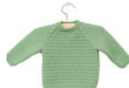
Lou (klein), p. 60