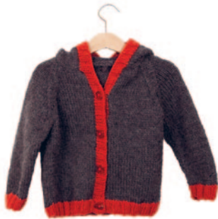
Lola, p. 122