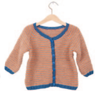
Axel en Axelle (groot), p. 112 en p. 118