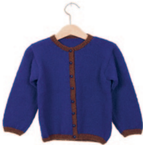
Roos, p. 104