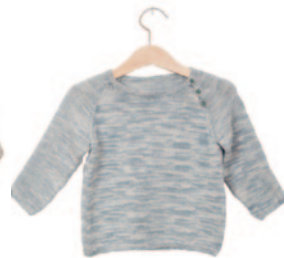
Kamiel, p. 52