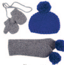
Nette, p. 100