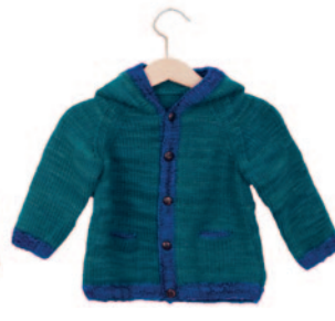
Moo, p. 88