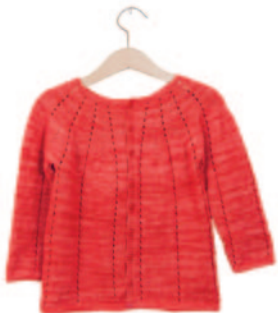
Lore, p. 85