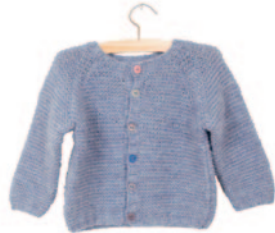
Axel en Axelle (klein), p. 64