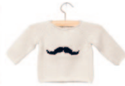
November-truitje, p. 44