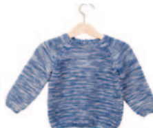
Lars (klein), p. 58