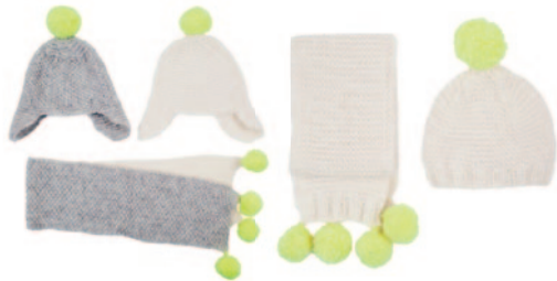
Seppe en Seppa, p. 68