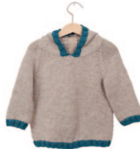
Oton, p. 66 (voor en achter)