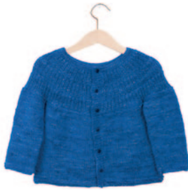
Stien, p. 106