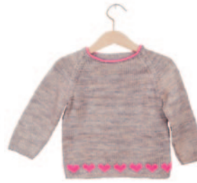
Lies, p. 82