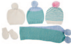
Jules en Julie, p. 26