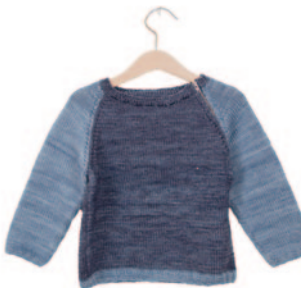
Marcel, p. 116