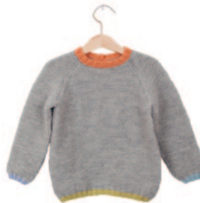
Lars (groot), p. 110