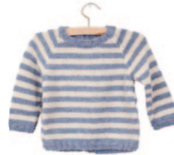
Elsie, p. 72