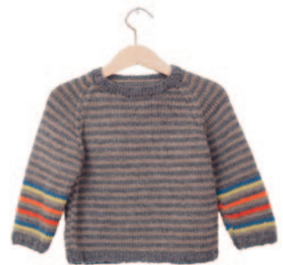
Leon, p. 120