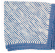
Louis en Louise, p. 38