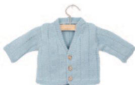
Emiel, p. 54