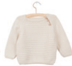
Lou (groot), p. 74