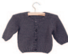
Mil, p. 46