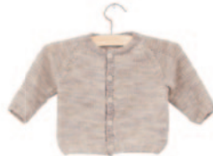
Staf, p. 50