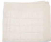
Arthur, p. 42