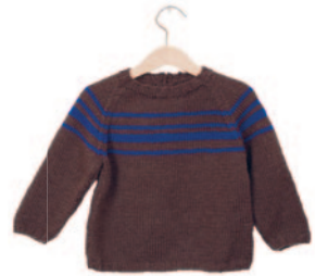
Benoit, p. 102