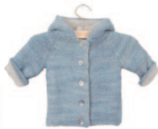
Jos en Josefiën, p. 34