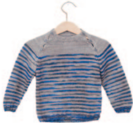
Flor (groot), p. 32