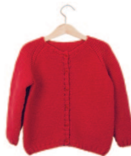
Axel en Axelle (groot), p. 118