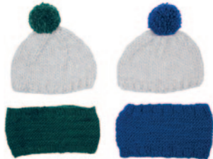
Toon, p. 98