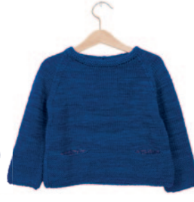
Violetta, p. 90