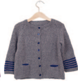
Liz, p. 92