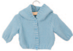
Charlotte, p. 24