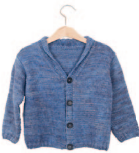
Jerome (groot), p. 114