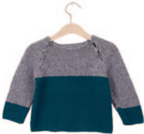
Ferre, p. 94