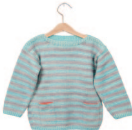
Lena, p. 76