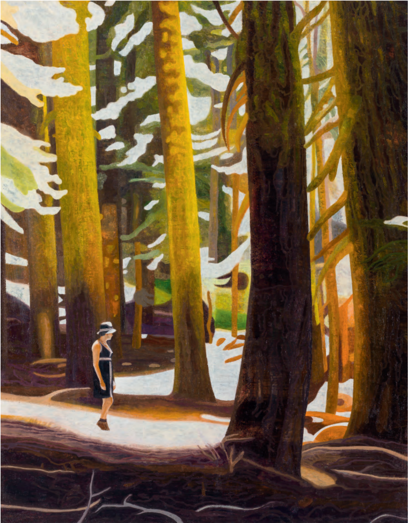
Moss Wood 2014, 100 x 80