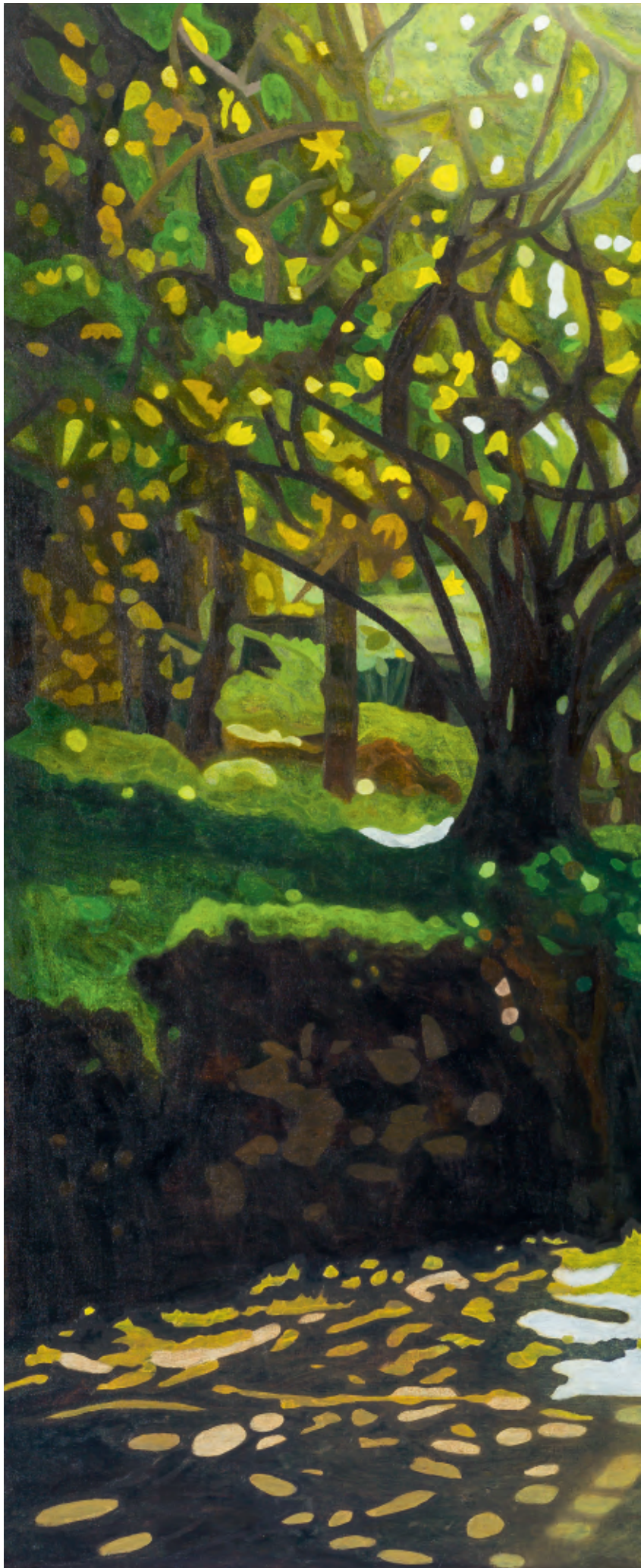
P&M's Place 2014, 160 x 200