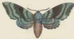
De Populervlinder (Sphinx populi).