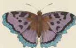
De groote Scherflapper ( Vanessa polychloros ).