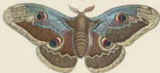
Het nachspanner (Stenocaulis pyri).