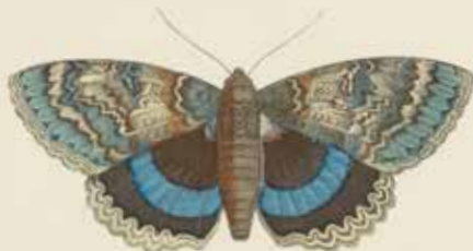
Het kleine wiesvlinder (Cateana fraxini).