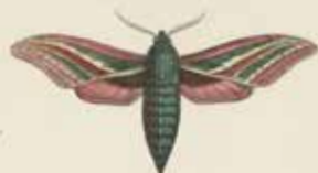
De Dinsvlinder (Delia parda).