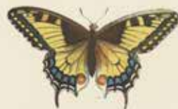
De Zwalerwants ( Papilio Machaon ).