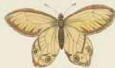
De Glaskapel ( Doridis ).