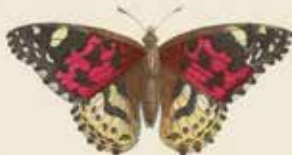
De Diatellkapel ( Tachypitris eubetis ).