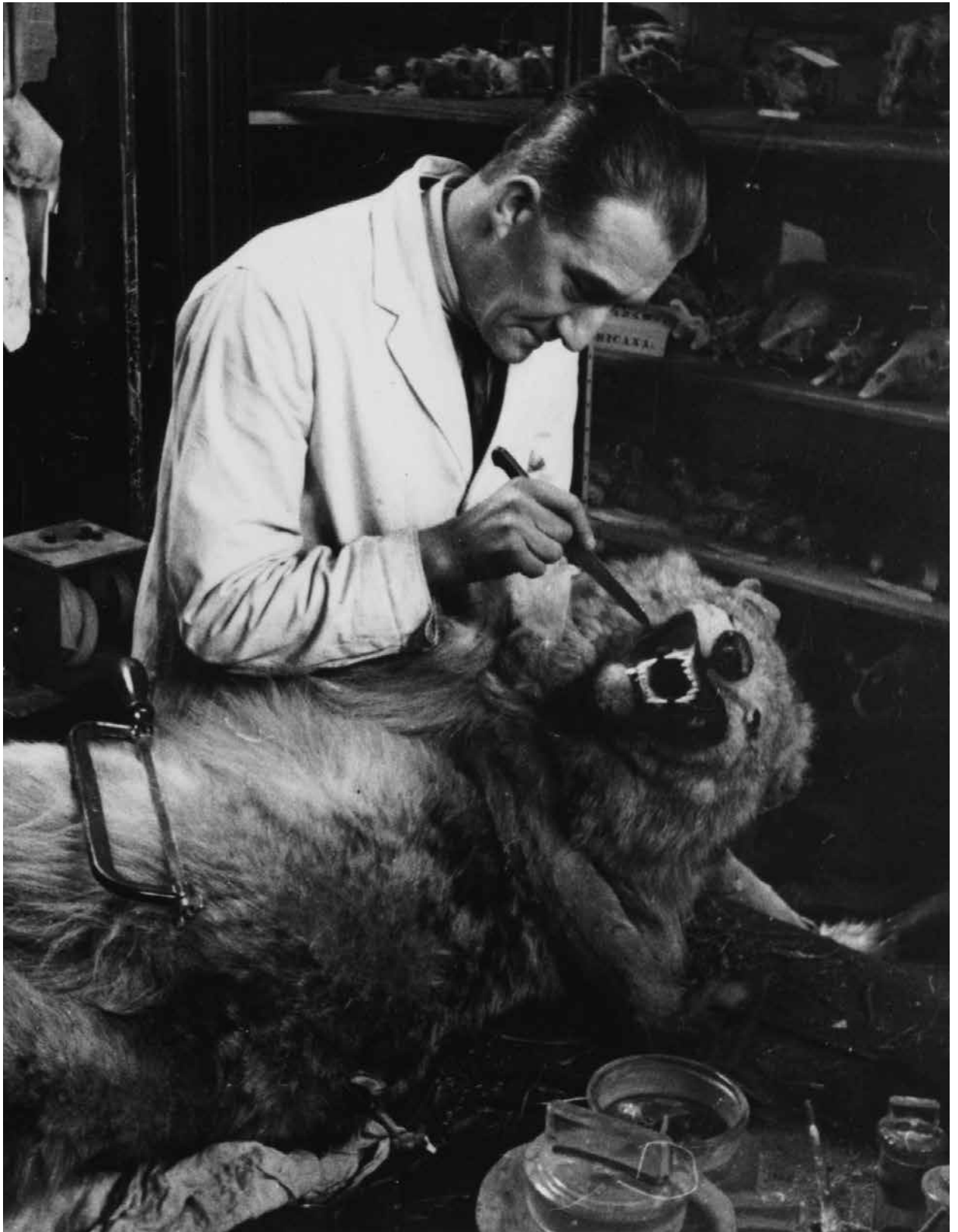
Taxidermist aan de slag met wolventanden, een foto behind the scenes voor Weekly Illustrated uit 1935.