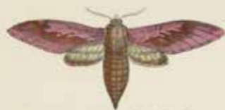
De Damsvlinder (Sphinx Funaria).