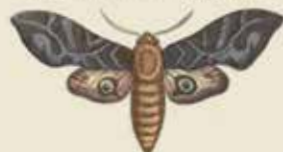
Het nachspanner (Sphinx vestita).