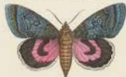
Het rode wiesvlinder (Cateana rupe).