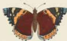
De Nieuwekapel ( Vanessa atalanta ).