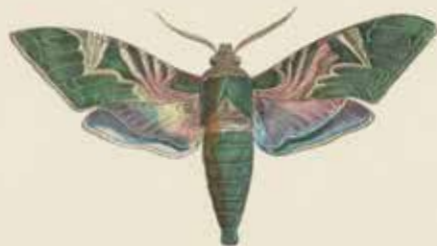
De Gansvlinder (Delia neri).