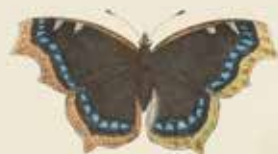
De Koningmantel ( Vanessa antiope ).