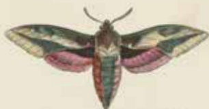
De Walstvlinder (Sphinx asphodii).