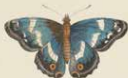
De Irievlinder ( Apatura iris ).