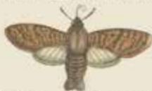
De nachspanner (Macroglossa olearum).