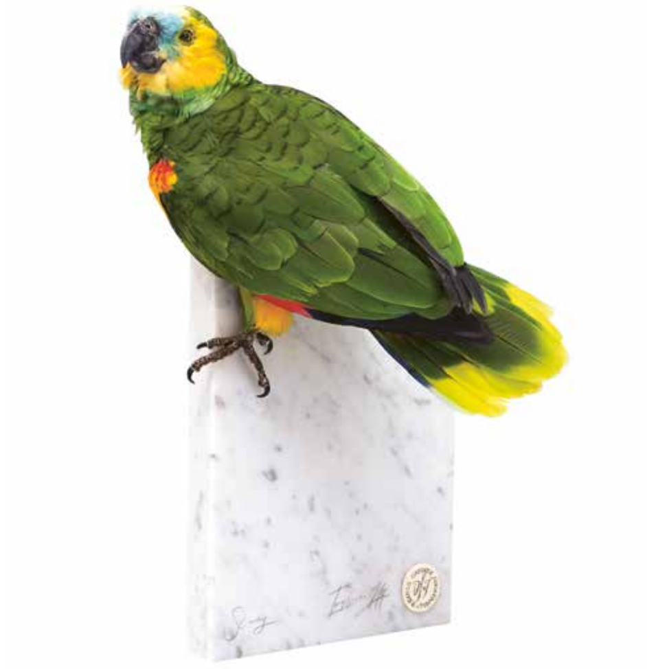
Darwin, Sinke & van Tongeren, Blue-Fronted Amazon , 2015.