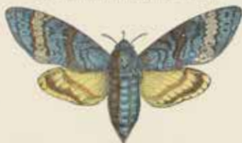
De Donsvlinder (Acherontia atropis).