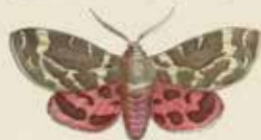
De Boekapel (Euxoa Caja).