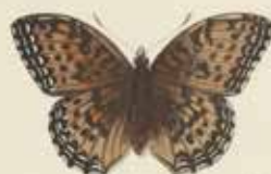
De groote Paarlouwerkapel ( Argynnis Aglaja ).