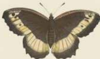
De Inzigg-voskapel ( Tachypitris herosine ).