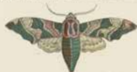
De Lindenvlinder (Sphinx ilias).