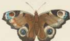
De Paauwvogelvlinder ( Vanessa J6 ).