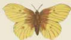
De Citroenkapel ( Collas ).