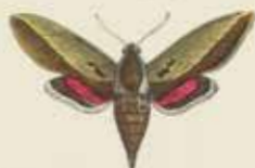
De Damsvlinder (Sphinx lipophanes).