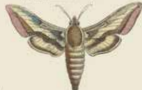
Het Waldmannvlinder (Sphinx galli).