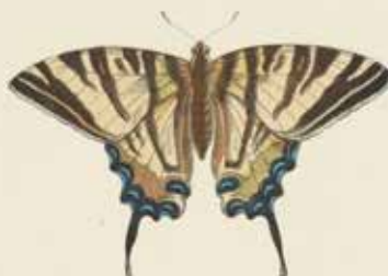
De Zelevlinder ( Aemanita podalirius ).