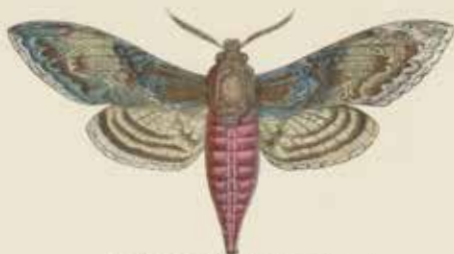
De Cansvlinder (Sphinx Cansvull).