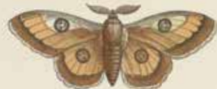
De Tuskapel (Aglaia Tau).