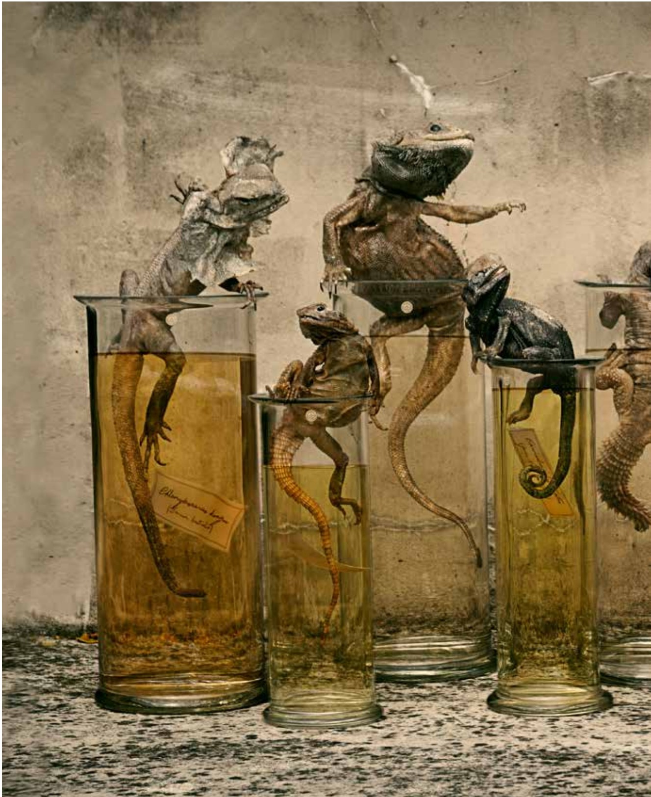
Darwin, Sinke & van Tongeren, Specimen .