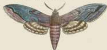
De Ligtvlinder (Sphinx Egeus).