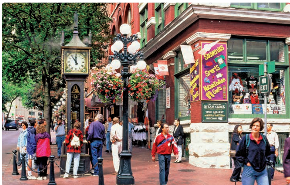
▲ Gastown Vancouver: om het uur blaast de 'steam clock' op de hoek van Water en Cambie Street een beetje stoom

werd de nederzetting, die eerst Granville en nadien Gastown werd genoemd, omgedoopt tot Vancouver. In hetzelfde jaar richtte een immense brand grote verwoestingen aan, maar zelfs dat kon een verdere groei van Vancouver niet stuiten. In 1887 stopte de eerste stroomtrein bij de zaagmolen aan de rand van de wildernis. Die ondertussen bloeiende onderneming profiteerde optimaal van de houtrijkdom in de omgeving. De hoge bomen van de kustgebieden kwamen goed van pas als masten voor zeilschepen. In de volgende jaren werd een aantal beloftevolle economische activiteiten rond scheepsbouw en scheepvaart opgestart. En enkele jaren later waren de eerste zakelijke contacten met Azië een feit.