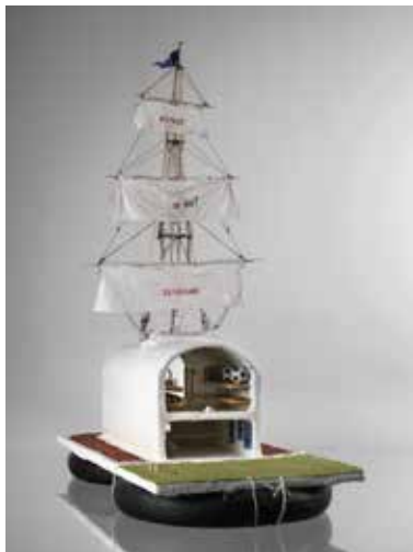
JAN FABRE Kunst is (niet) eenzaam, 1986 (divers média)

L'art est/n'est pas solitaire , désignation d'un paradigme des années 80, est un monde miniature qui véhicule la vision de Jan Fabre sur le métier d'artiste. Il a construit son radeau avec un gymnase, une piste d'athlétisme et un terrain de foot : peine partagée diminuée de moitié. Il évoque la force de l'espoir sur la fatalité ; l'art et la communication comme force de propulsion vers une destination prometteuse.