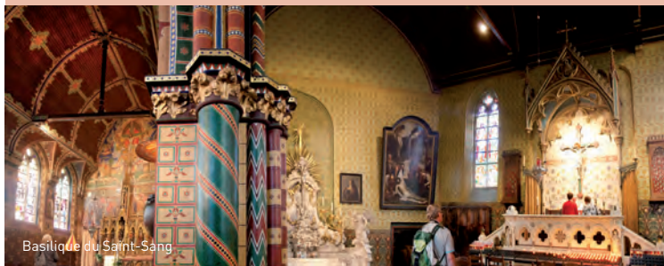
Basilique du Saint-Sang

Entre-temps, les amateurs d'art l'auront sans doute noté : le Burg présente une synthèse raffinée de tous les styles architecturaux les plus remarquables du passé. Du style roman (Chapelle Saint-Basile) et gothique (Hôtel de ville) au classicisme (demeure du Franc de Bruges), en passant par la Renaissance (Greffe Civil) et le baroque (Prévôté). Et tous ces styles réunis sur une seule et même place !