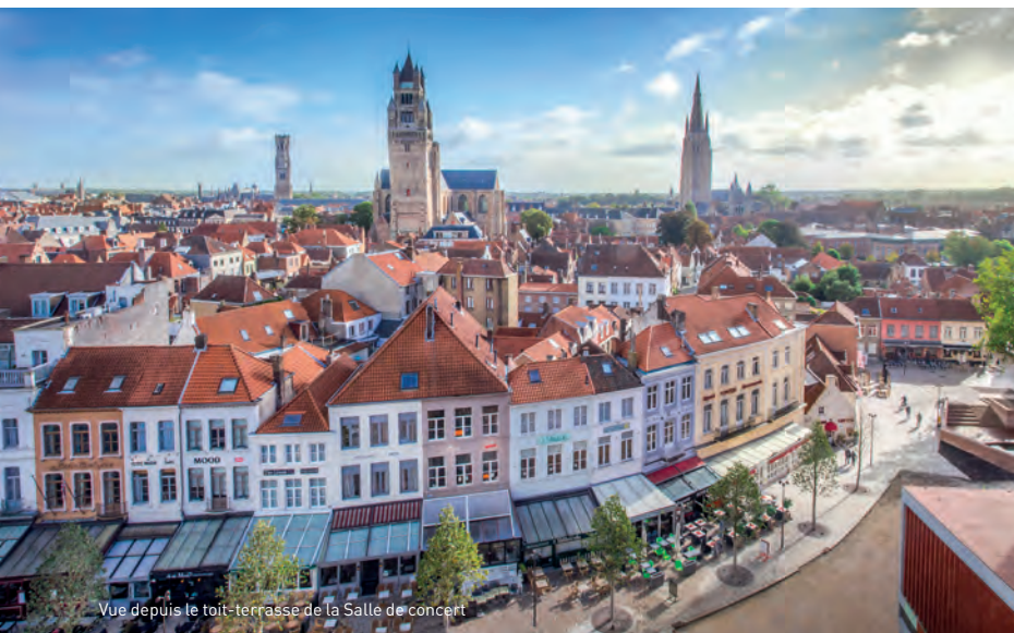
Vue depuis le toit-terrasse de la Salle de concert

Si fière que soit Bruges de son statut mérité de ville du patrimoine mondial, elle n'en regarde pas moins vers l'avenir ! Cette promenade vous mène vers des panoramas mondialement célèbres, des monuments hauts comme des tours et des places vieilles de plusieurs siècles, mais rajeunies par des constructions contemporaines. Un pied dans le Moyen Âge et l'autre bien ancré dans le présent. Un itinéraire vivement recommandé à tous ceux qui visitent Bruges pour la première fois et qui veulent découvrir immédiatement ce qui fait sa réputation. Préparez votre appareil photo !