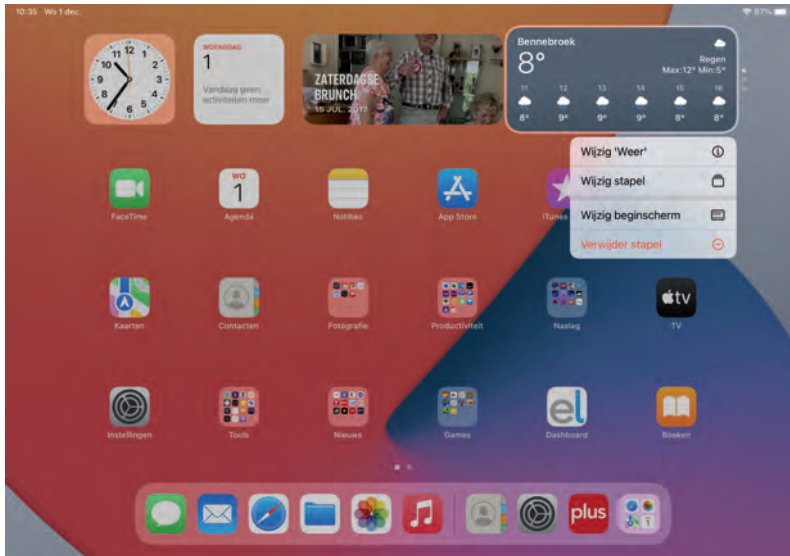
Het beginscherm met widgets en rechts twee slimme stapels.